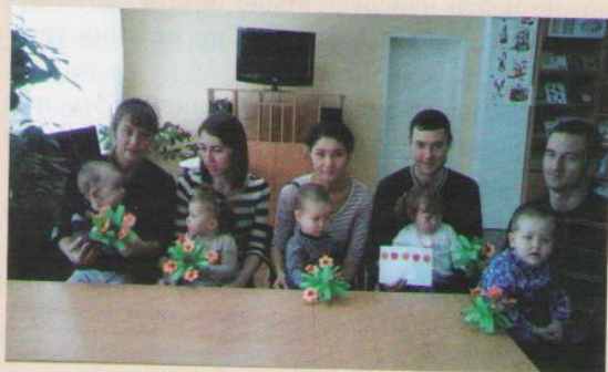
Мы пришли в библиотеку!

Но многие родители сталкиваются с тем, что дети наотрез отказываются брать в руки книгу. А родители, в свою очередь, забывают о том, что научить ребёнка читать – это половина дела, важно привить любовь к книге, чтобы чтение было