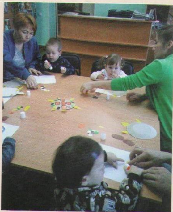
У кого дом всегда с собой?

гает продолжить игру, но уже в более спокойном темпе.